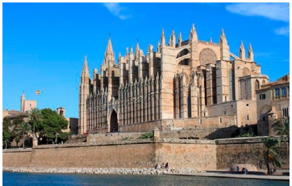
Das berühmteste Fotomotiv in Palma

Uhlig: Die Anleihemittel sollen für die Wachstumsfinanzierung innerhalb unseres bewährten Geschäftsmodells genutzt werden. Künftig soll jedes Jahr