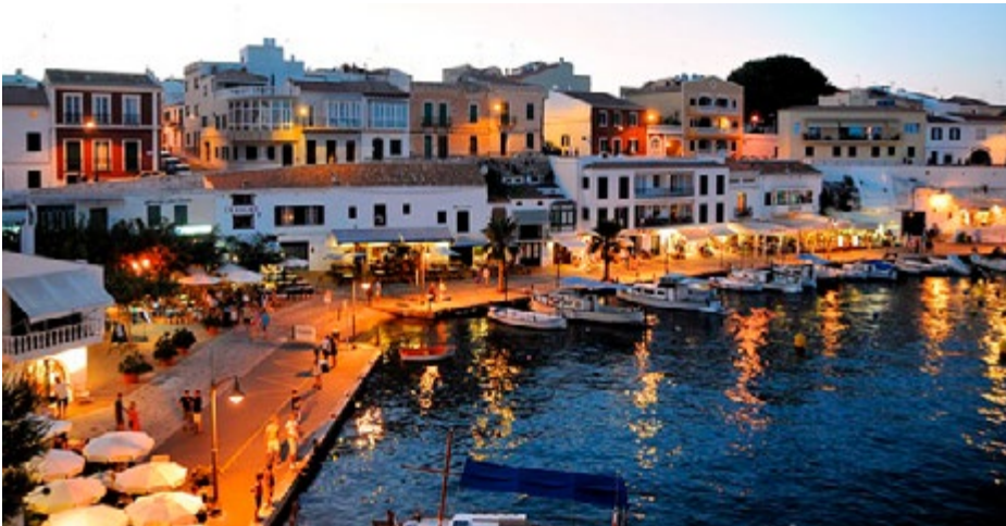
Mittelmeeridylle auf den Balearen

überproportional gestiegen. Was zieht die Superreichen an?